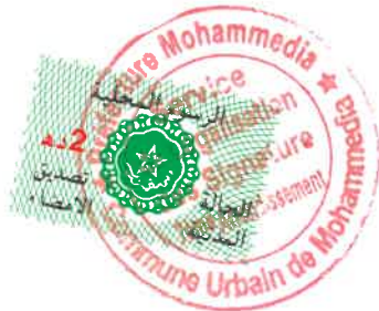
PHOTO CERTIFIÉE CONFORME A L'ORIGINAL Mohammedia le 23 Jul 2019